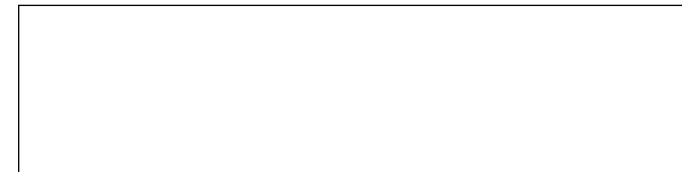
22,5x90 - 9"x36" Naturale/Rettificato - Matte/Rectified