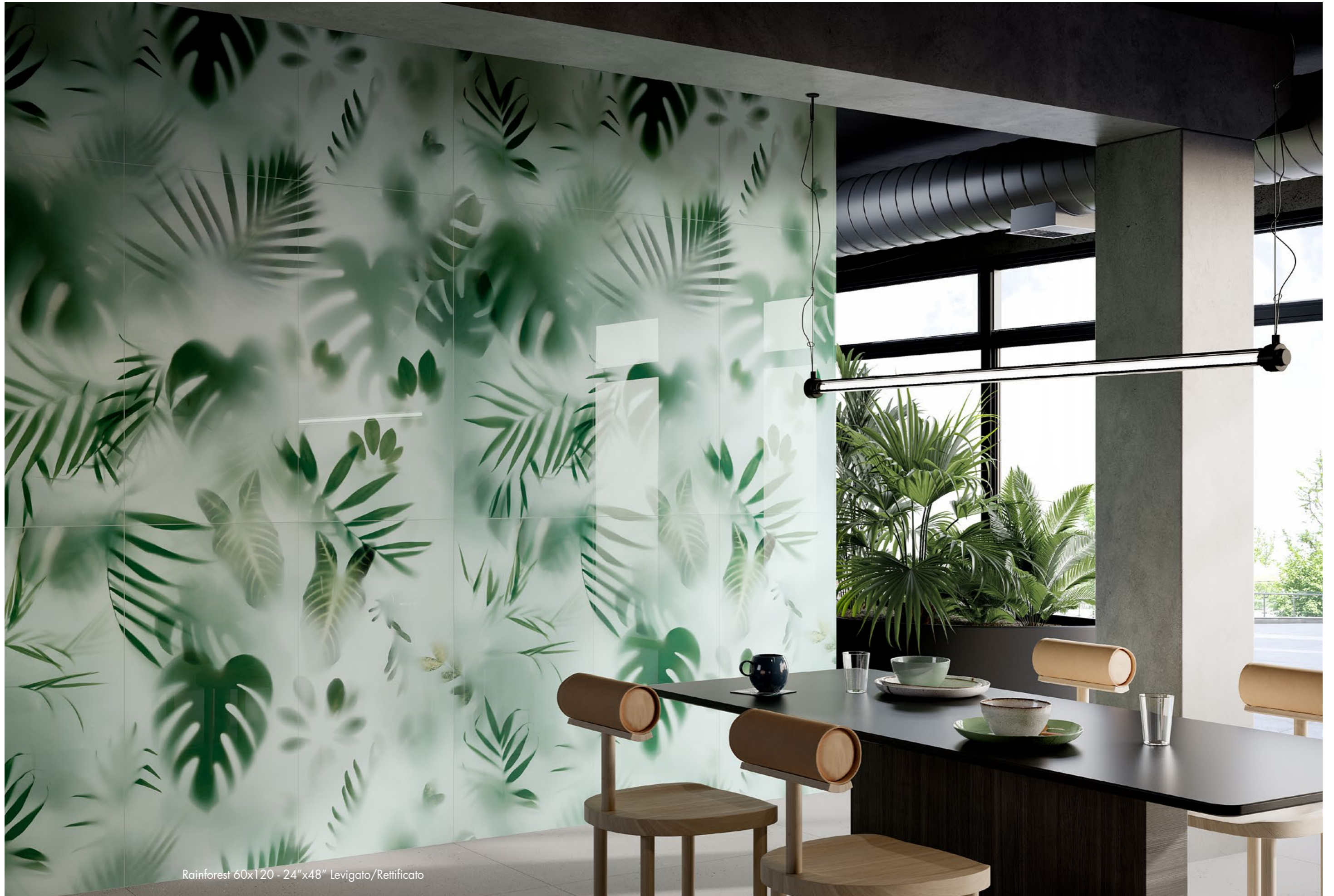
Rainforest 60x120 - 24"x48" Levigato/Rettificato