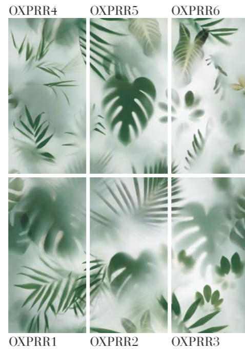
OXPRR1 OXPRR2 OXPRR3 OXPRR4 OXPRR5 OXPRR6

OXR62PR Rainforest 1 0,72 14,75 6 4,32 88,5 9 mm